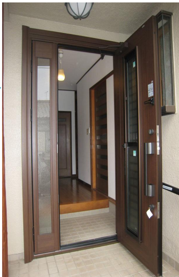
～ 施工後 ～