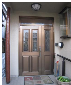
～ 施工前 ～