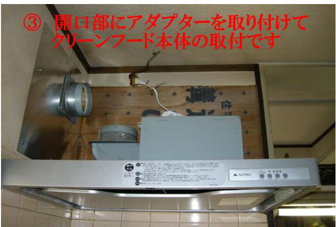
③ 開口部にアダプターを取り付けて クリーンフード本体の取付です