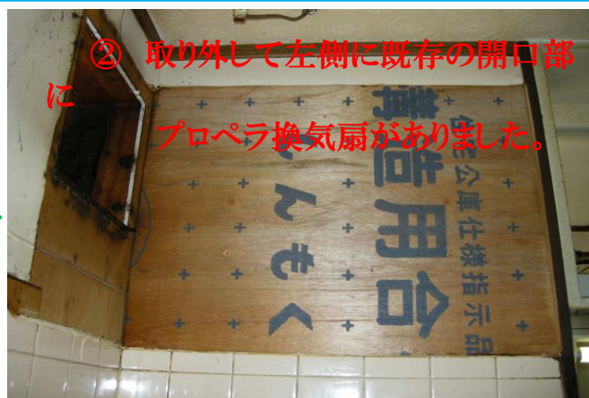
② 取り外して左側に既存の開口部 にプロペラ換気扇がありました。