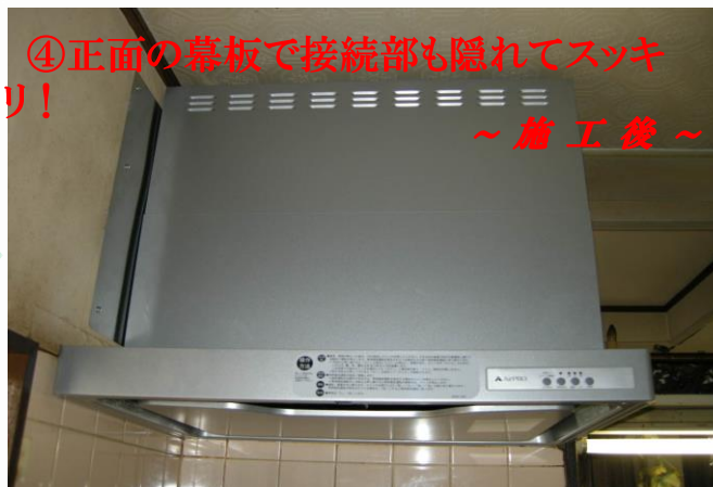
④ 正面の幕板で接続部も隠れてスッキ リ！ ～施工後～