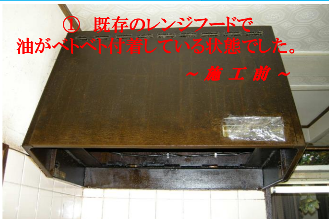
① 既存のレンジフードで 油がベトベト付着している状態でした。 ～施工前～